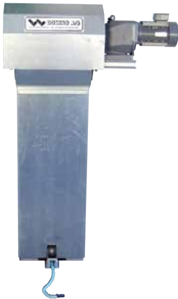
Station 0,55KW (54092)