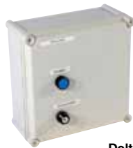
Delta 3 (64031)