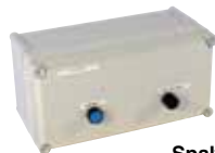
Spalte 1 (64030)