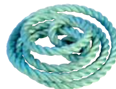
Nylon 20mm (64025)