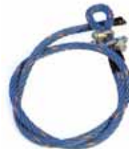
Taifun wire 12mm (64026)